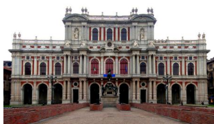
Palazzo Carignano (Torino)

venerdì 22 Aprile h 20,45 La VIA del SUCCESSO con Ami Stewart e Sergio Muniz Poltronissima €33,00